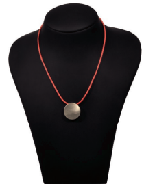
AURUM VITA - Element als runder Schmuckanhänger