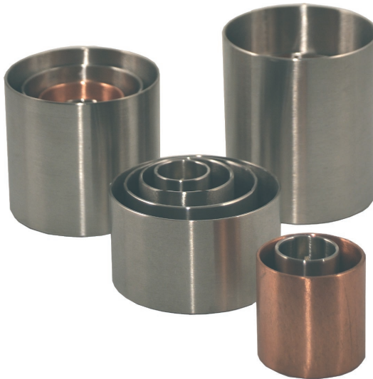
Die AURUM VITA - Ringmodule „RM-O“, „RM-I“, „RM-II“ und „RM-IV“

Die Anwendungsfälle reichen vom Schutz vor Störfeldern am Arbeitsplatz über die Verbesserung der Wohnqualität, bis hin zur Verbesserung der feinstofflichen Energien in Krankenhäusern und ähnlichen Einrichtungen. Auch im Zusammenhang mit der Tierhaltung lassen sich die AURUM VITA - Ringmodule unterstützend einsetzen.