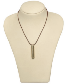
AURUM VITA - Element als Anhänger tragbar und zur Verwendung mit den AURUM VITA - Ringmodulen